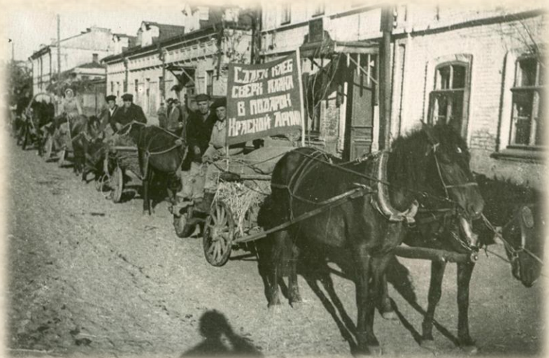
Хлеб в фонд Красной Армии. 1944 г.

В 1945 г. по сравнению с 1941 г. поголовье свиней сократилось в 3,9 раза, поголовье лошадей – в 1,9 раза.