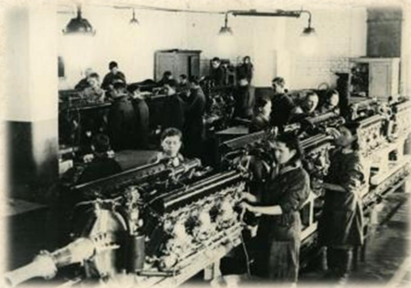
В цехе окончательной сборки самолетов Саратовского авиационного завода. Подготовка моторов к установке на самолет. 1942 г.

Валовая продукция промышленности в 1945 г. превысила уровень 1940 г. в 1,6 раза.