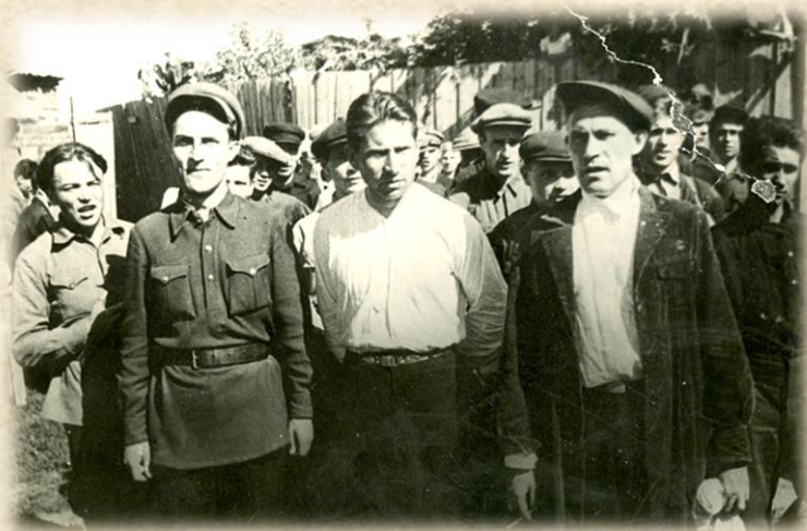
Добровольцы на фронт. Июнь. 1941 г.

Численность населения Саратовской области (в современных границах) на начало 1941 г. составила 2335 тыс. человек, на начало 1945 г. - 2124 тыс. человек.