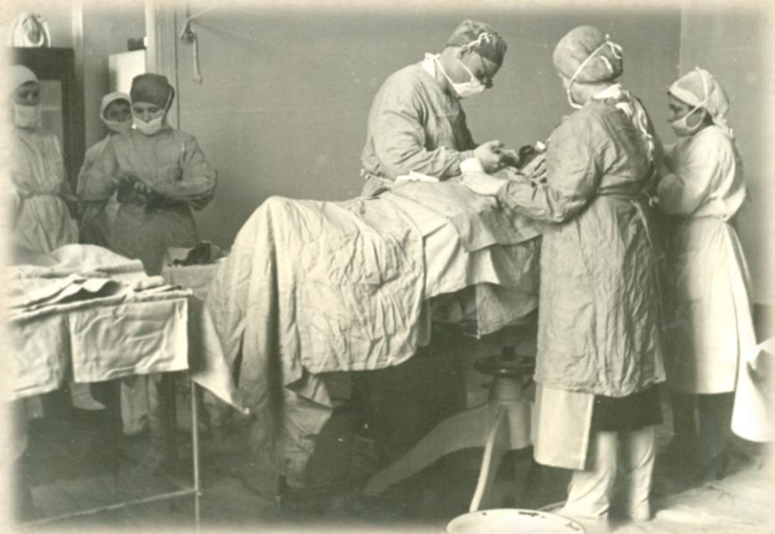
В одном из госпиталей Саратова. 1940-е гг.

На 10 тыс. жителей области в 1940 г. приходилось 10 врачей всех специальностей , в 1945 г. - 11.